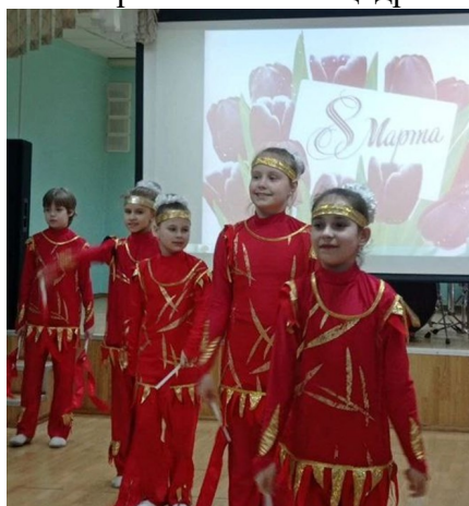
смотрите как наши дети

Хороший подарок учителю и прежде всего женщине — это несомненно положитель- ные эмоции, хорошее настрое- ние и март был на них щедр. По-